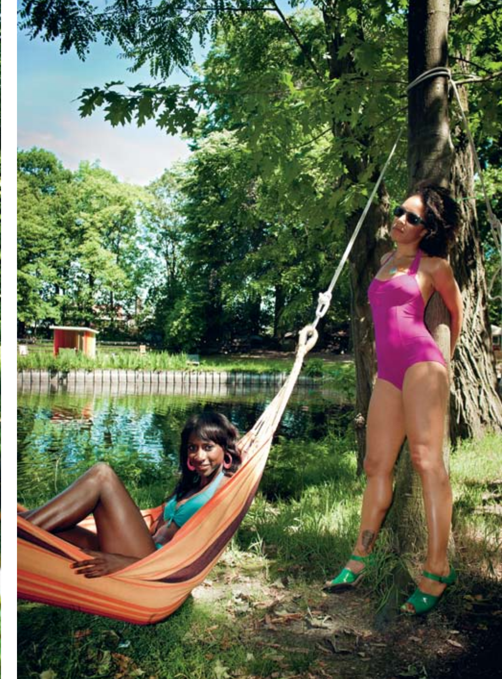
ELODIE Bikini, Niagara Oorbellen, Uterqüe