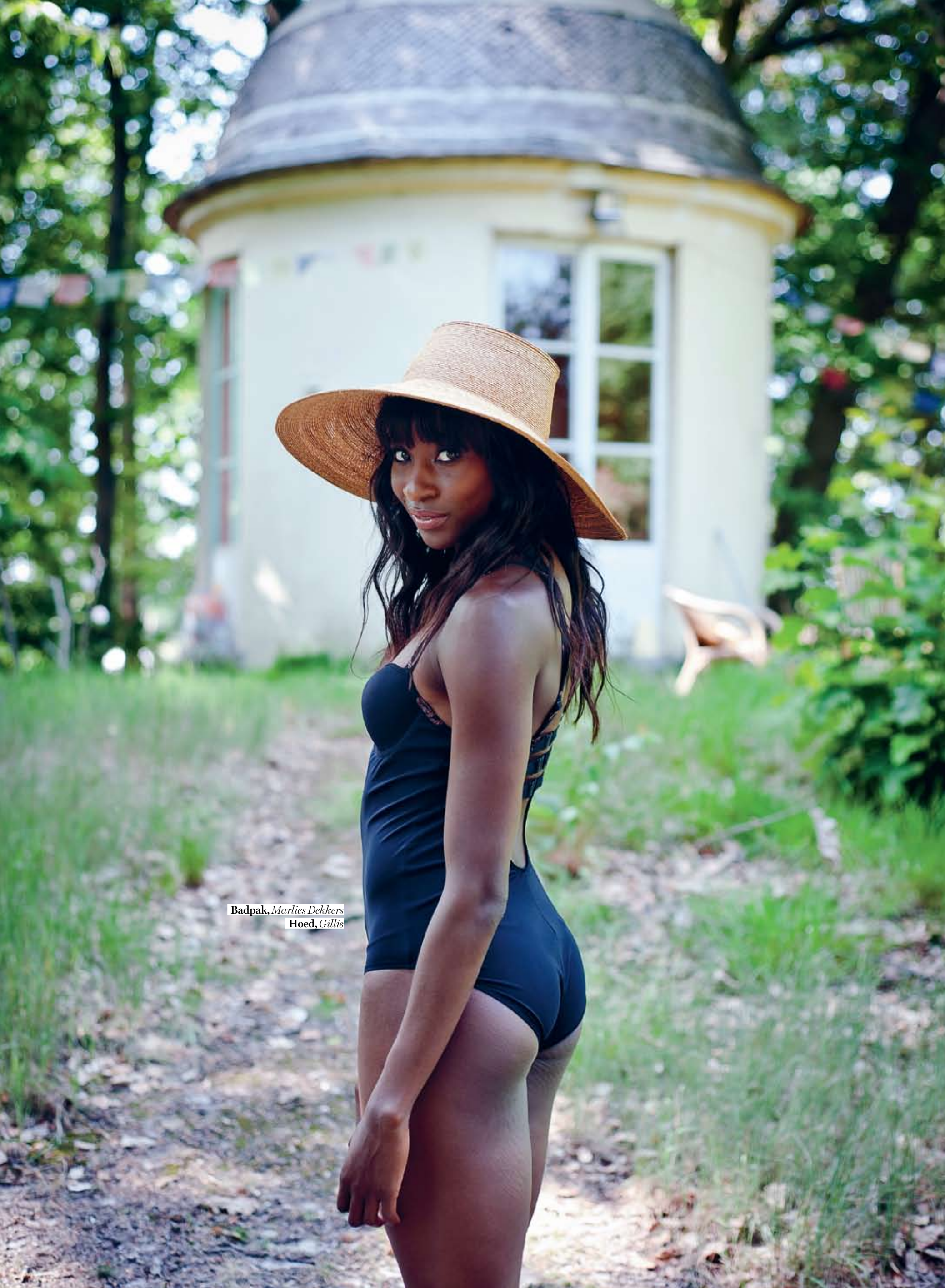
Badpak, Marlies Dekkers Hoed, Gillis