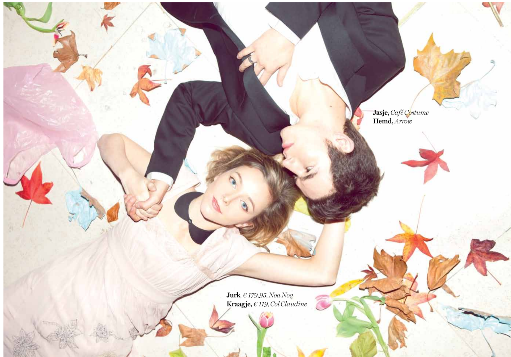
Jasje, Café Costume Hemd, Arrow