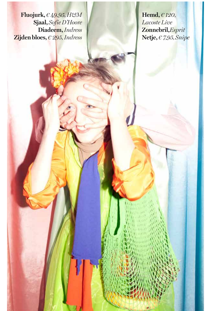
Fluojurk, € 19,95, H&M Sjaal, Sofie D'Hoore Diadeem, Indress Zijden bloes, € 295, Indress

'Ik begrijp echt niet waarom zo veel vrouwen en meisjes platte ballerina's dragen, met zo'n geknoopt strikje op en een blote wreef. Dat vind ik zo fout. Bij mannen weet ik het niet meteen, maar blinkende hemden kunnen er ook echt fout uitzien, net als sommige sportschoenen.'