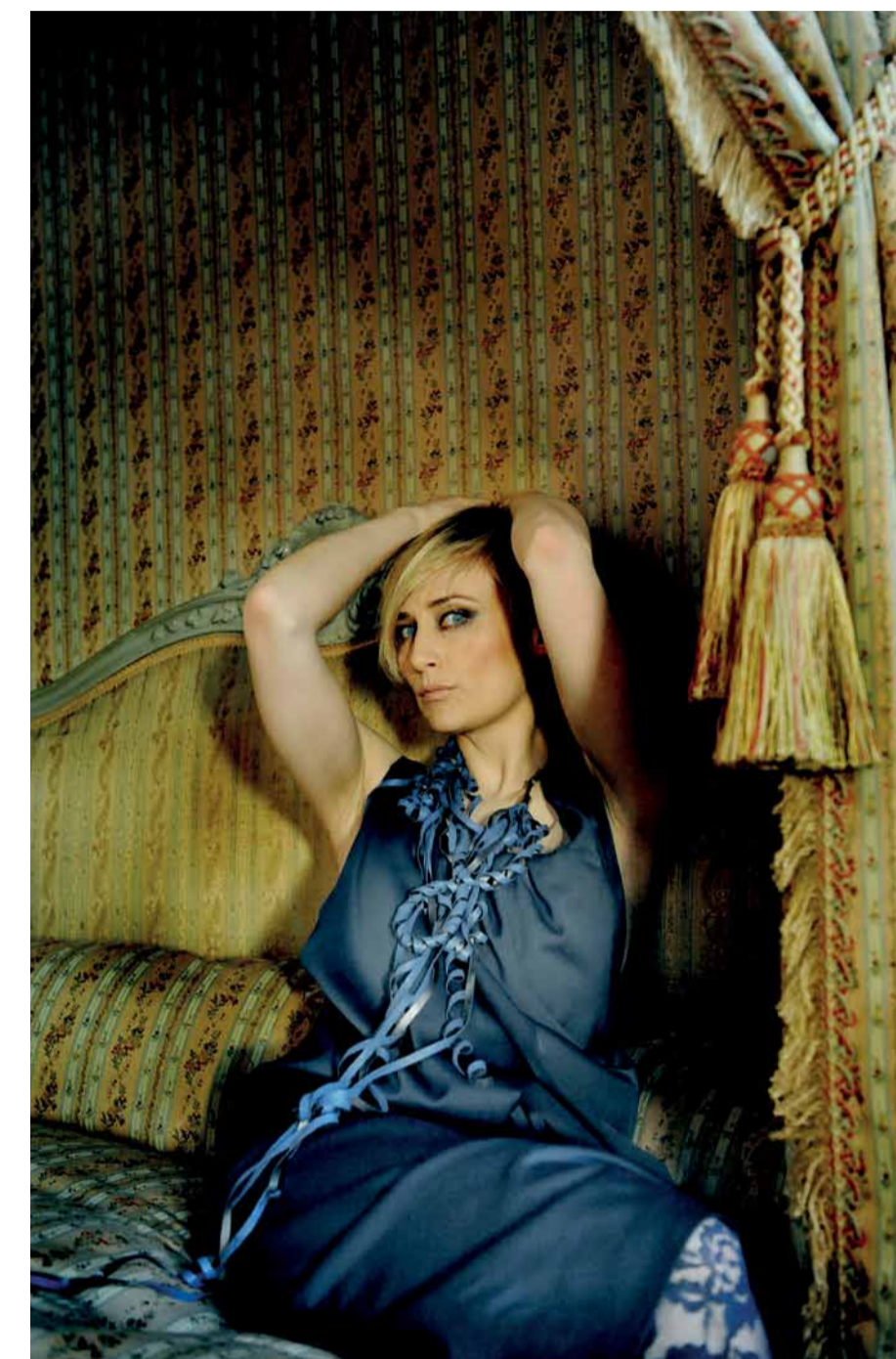
Jurk, Christian Wijnants bij Sien Leren halsketting, Maison Martin Margiela Legging, Topshop