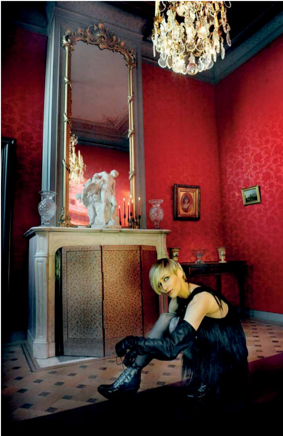
Jurk , Ann Demeulemeester Handschoenen , Haider Ackermann bij Stijl Laarsjes , Givenchy bij Virt and Real Ketting , Olivia Hainaut Panty's , Cette Kandelaars en kaarsen , Ikea