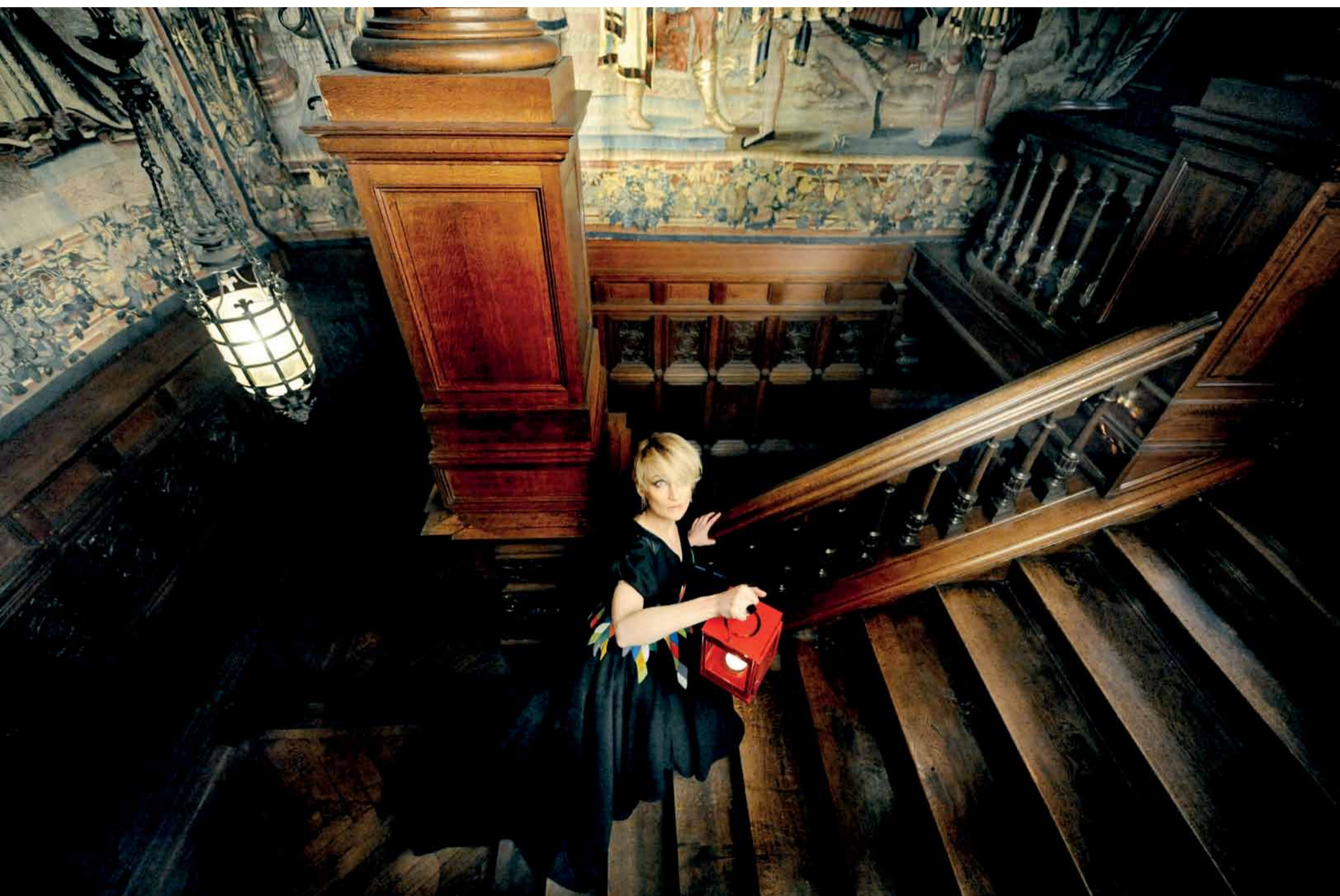
Jurk uit meubelstof en leer, Harald Ligetvoet voor Projectatelier (veiling via Ebay t.v.v Music for Life, www.pimpmjoffice.be) Oorbellen en ring, Wouters & Hendrix Legging en schoenen, Urban Outfitters Lantaarn, Ikea