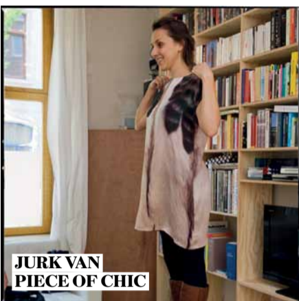
JURK VAN PIECE OF CHIC