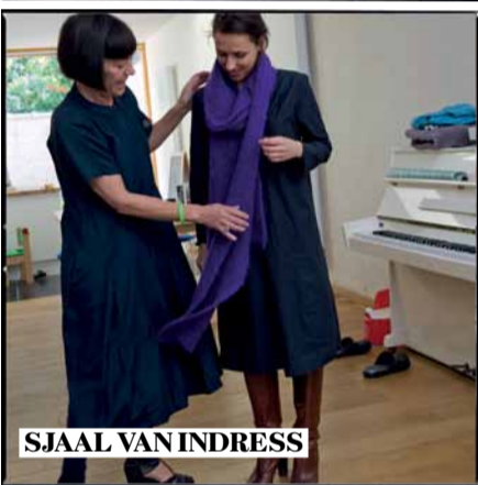
SJAAL VAN INDRESS