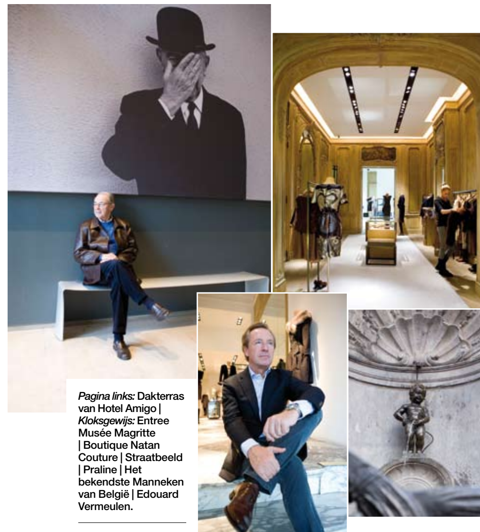
Pagina links: Dakterras van Hotel Amigo | Klokgewijs: Entree Musée Magritte | Boutique Natan Couture | Straatbeeld | Praline | Het bekendste Manneken van België | Edouard Vermeulen.

Tekst MALU KIRSCHBAUM