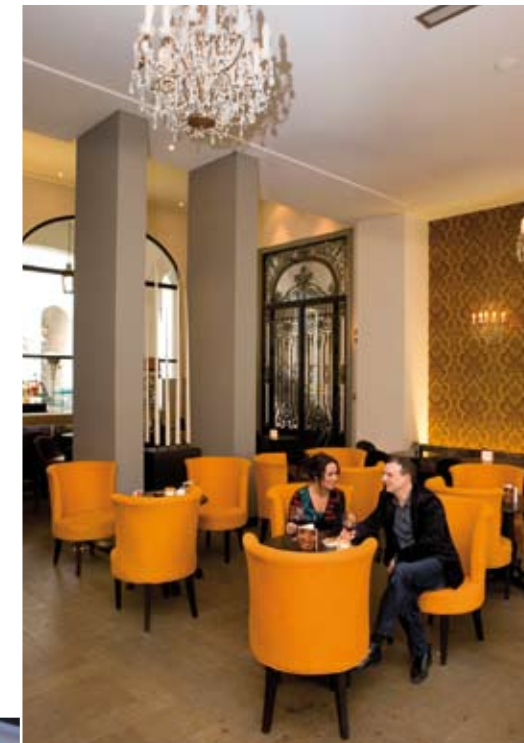
Boven: The Dominican loungebar. Onder: Odette en Ville.

Liefhebbers van designhotels kunnen terecht bij The Dominican of Be Manos . Een kleinere en zeer intieme variant is nieuwkomer Odette en Ville . Dit exclusieve boetiekhotel, dat in oktober is geopend, heeft slechts acht slaapvertrekken – elk met een verschillende inrichting. Een aanbeveling voor wie niet mee wil gaan met de massa en ook tijdens de reis op zoek is naar het huis-kamergevoel. □